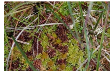
Charakteristische Hochmoorgesellschaft

Weitere Informationen zum Wettbewerb und zum Projekt finden Sie zudem auf der Webseite der DVS ( www.dvs-wettbewerb.de ) sowie auf der Seite des Ökologischen Schutzstation Steinhuder Meer e.V. ( Projekt Torfmoosvermehrung (oessm.org) ).