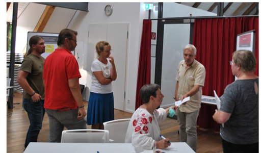
Workshop zur Vorbereitung der Fortschreibung des Gemeindeentwicklungsplan für die Wedemark.

Der Gemeindeentwicklungsplan (GEP) für die Wedemark wurde 2015 verabschiedet. Er enthält Leitbilder, Ziele und Maßnahmen für die zukünftige Entwicklung der Wedemark. Nun ist es Zeit für eine Aktualisierung des Gemeindeentwicklungsplans. Dabei soll die Bevölkerung aktiv einbezogen werden. Mit der bewilligten LEADER-Förderung will die Gemeinde ein externes Büro mit der Fortschreibung beauftragen. Anfang 2024 soll mit der Erarbeitung begonnen werden.