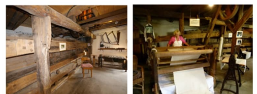
Kastenmangel Steinhude