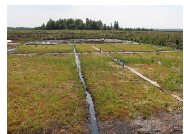
Torfmoosfeld 2021