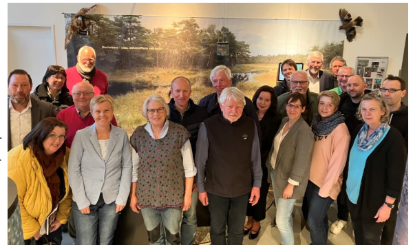
Neue LAG Meer & Moor (nicht vollzählig)