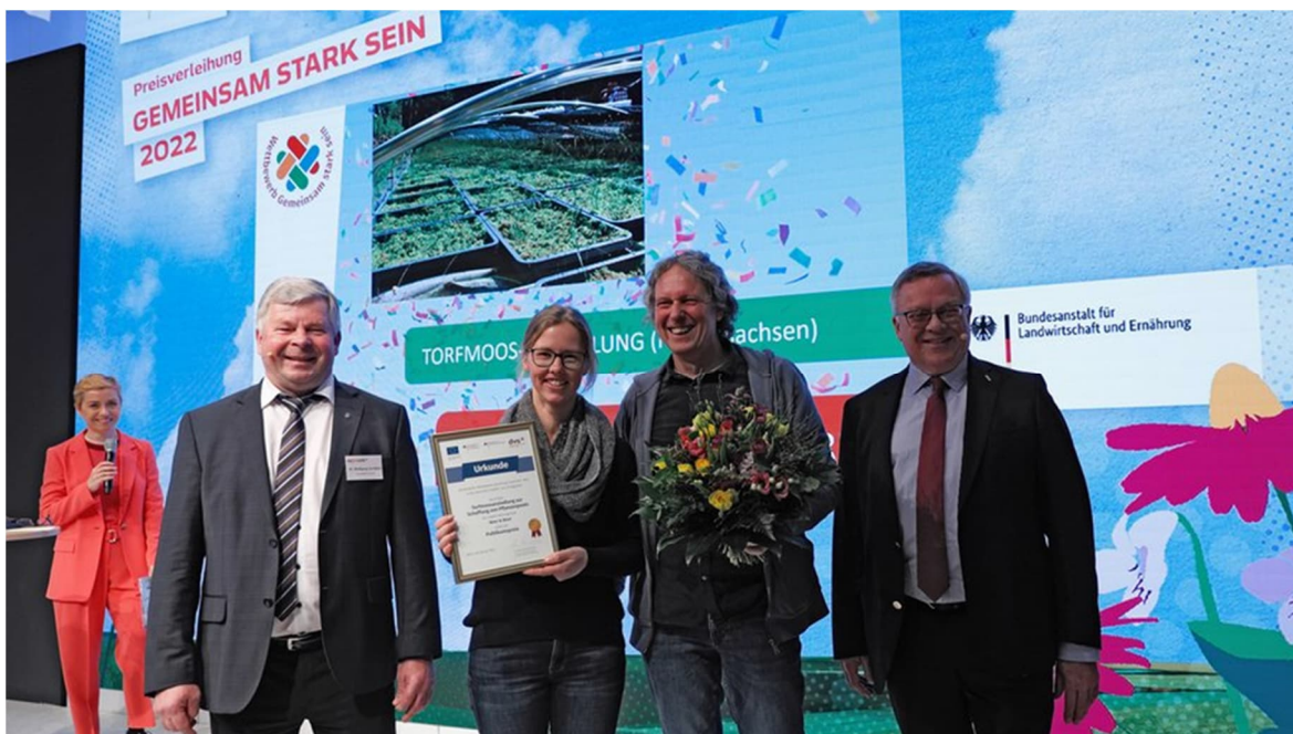
Preisübergabe auf der IGW am 26.01.2023 in Berlin