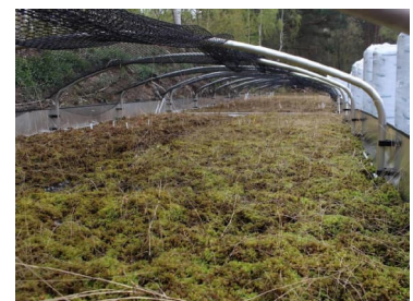
Gewächshaustische mit Torfmoosen, Quelle: ÖSSM