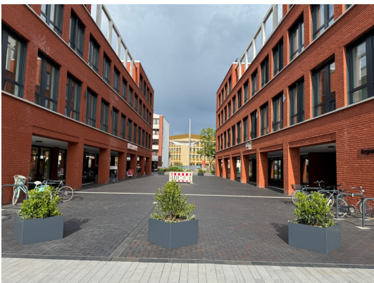
Fehlende Baumpflanzungen zwischen den beiden Gebäudeteilen des NeuStadtTors

In den ursprünglichen Planungen war eine Baumreihe zwischen den beiden Gebäuden vorgesehen. Die Teilnehmenden bemerken kritisch, dass diese nicht realisiert wurde. Auch hier wären eine Entsiegelung und Begrünung, ggf. auch nachträglich durch größere Kübelpflanzungen ebenso wie die Schaffung von Sitzmöglichkeiten wünschenswert.