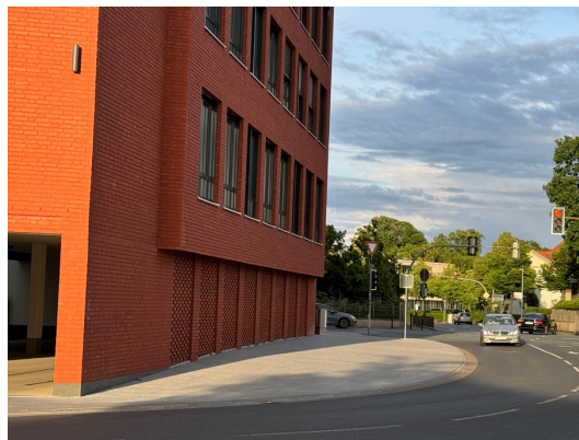
Breite Gehwege bieten Potenziale für Entsiegelung und die Ergänzung einzelner Baumpflanzungen