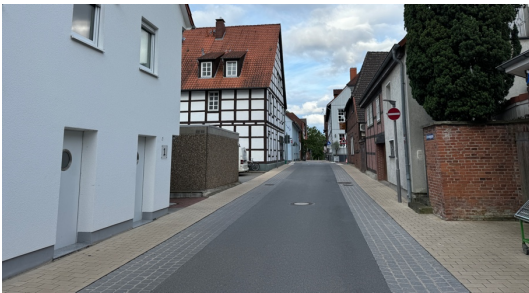
In der Fahrradstraße gibt es nur wenige entsiegelte Flächen oder Bepflanzungen.

Die im Zuge der Herstellung der Fahrradstraße entstandene Stellplatz- und Wendeanlage Am Wallhofs wird durch alle Teilnehmenden als deutlich zu groß und zu stark versiegelt bewertet. Es wird angeregt diese in Teilen wieder zu entsiegeln sowie Baumpflanzungen zu ergänzen.