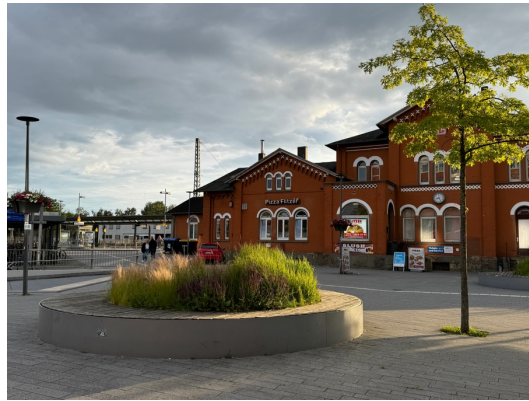
Es wurde vorgeschlagen weitere Bäume in den bestehenden Beeten zu pflanzen, um den Platz stärker zu verschatten.