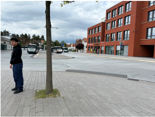
Kleine Baumscheiben und starke Versiegelung im Bahnhofsvorbereich