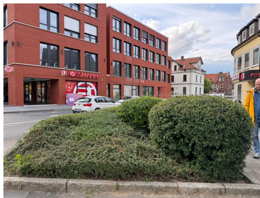
Eine insektenfreundliche und biodiversitätsfördernde Bepflanzung im Bereich Lindenplatz ist wünschenswert.