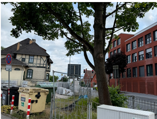
Die Bestandsgehölze sollen beim Umbau des Rathausumfeldes erhalten bleiben.

Die langfristig vorgesehene Grünfläche, die in diesem Bereich vorgesehen ist, wird als zu klein bewertet. Außerdem merken die Anwesenden an, dass die großflächigen Stellplatzbereiche keine Versickerungsmöglichkeiten bieten. Hier wird angeregt, Teilbereiche zu entsiegeln und die Stellplätze selbst versickerungsfähig zu gestalten.