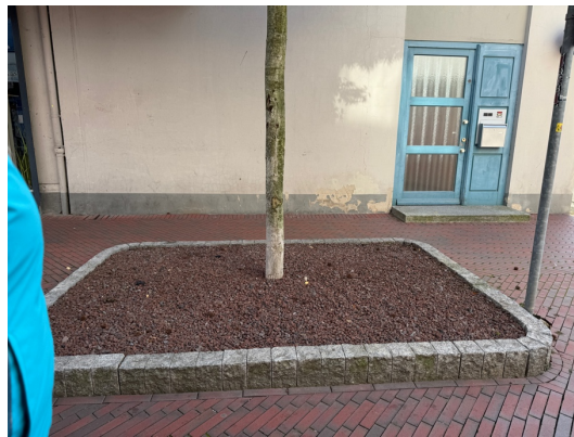
Die Bestandsgehölze sollen beim Umbau des Rathausumfeldes erhalten bleiben.

Für die Bepflanzung und Pflege der Baumscheiben könnten ggf. Geschäftsinhabende oder Anwohnende aktiviert werden.