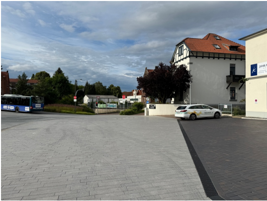
Der neu gepflasterte Bereich im Übergang zur Marktstraße ist stark versiegelt. Auch hier könnten einzelne Baumpflanzungen ergänzt werden.

Einige Teilnehmende schlagen vor, die Baumscheiben an der Kreuzung Marktstraße/Wunstorfer Straße stärker und artenreicher zu bepflanzen, um die Biodiversität punktuell zu stärken.