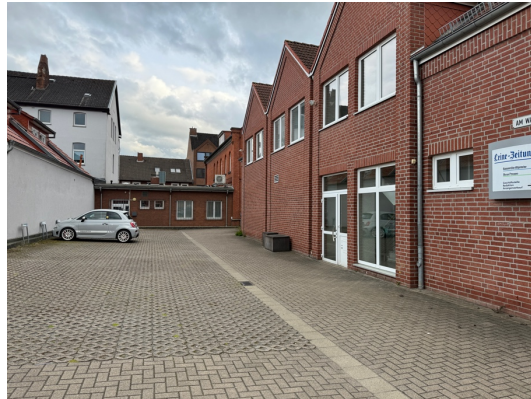
Auch viele private Innenhof- und Stellplatzflächen im Innenstadtbereich sind stark versiegelt.

Die Teilnehmenden betonten auch, dass bei der Innenstadtsanierung ein stärkerer Fokus auf Fragen des Klimaschutzes sowie der Klimaanpassung gelegt werden sollte. Es besteht das Gefühl, dass diesen in Abwägungsprozessen bisher ein geringerer Stellenwert als anderen Belangen zugeschrieben werde, dies aber nicht mehr zeitgemäß und den aktuellen Bedarfen angemessen sei.