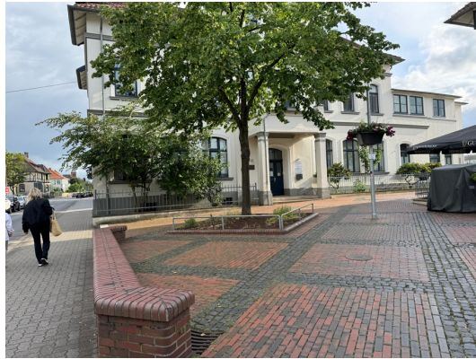
Die Baumscheiben an der Kreuzung Marktstraße/Wunstorfer Straße bieten die Möglichkeit einer artenreicheren Bepflanzung.