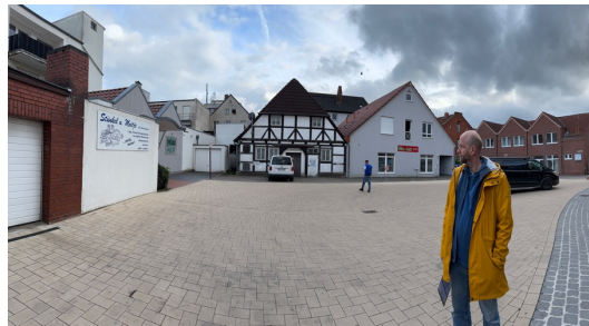
Die neu entstandene, versiegelte Platzfläche am Wallhofs sollte laut den Teilnehmenden teilentsiegelt und durch eine Baumpflanzung ergänzt werden.